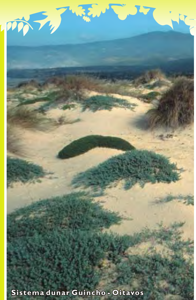
Sistema dunar Guincho - Oitavos

Para mais informações sobre outros Percursos disponíveis, contacte: