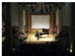
Centro Cultural de Cascais