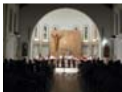
Igreja dos Salesianos

Festival ao Largo 2012 www.festivalaolargo.com