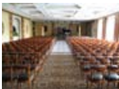
Sala Atlântico - Hotel Palácio

17.00h. | Museu da Música Portuguesa | Monte Estoril 14 Julho | Guitarra 21 Julho | Piano 28 Julho | Canto