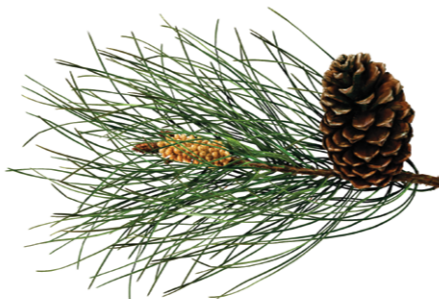
Pinheiro-bravo | Pinus Murta ( Pinaster )