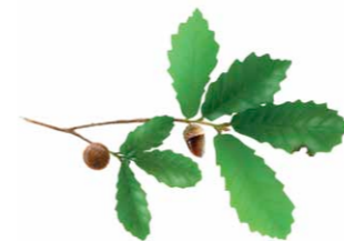
Carvalhiça | Lusitanian Oak ( Quercus lusitanica )