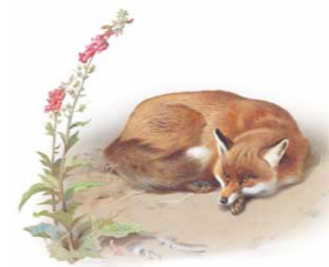
Raposa | Fox ( Vulpes vulpes )