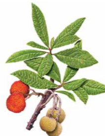
Medronheiro | Strawberry tree ( Arbutus unedo )