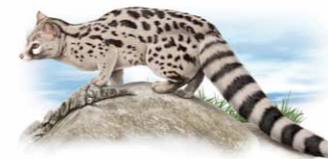
Geneta | Common genet ( Genetta genetta )