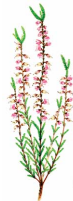
Torça | Common Heather ( Calluna vulgaris )