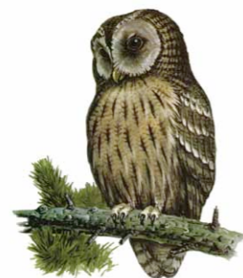
Coruja do Mato | Tawny Owl ( Strix aluco )