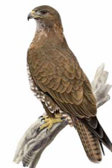
Águia-de-asa-redonda | Common Buzzard ( Buteo buteo )