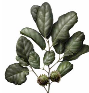
Sobreiro | Cork oak ( Quercus suber South)