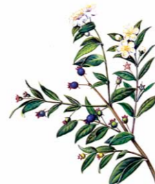
Murta | Murta ( Myrtus Communis )