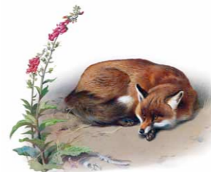
Raposa | Fox ( Vulpes vulpes )