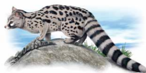
Geneta | Common genet ( Genetta genetta )