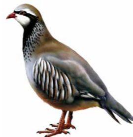
Perdiz-vermelha | Red-legged Partridge ( Alectoris rufa )