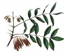
Freixo-de-folha-estreita | Narrowleaf ash ( Fraxinus angustifolia )