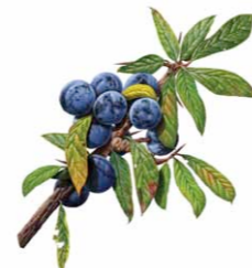
Abrunheiro-bravo | Blackthorn ( Prunus spinosa )