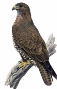
Águia-de-asa-redonda | Common Buzzard ( Buteo buteo )