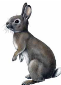
Coelho-bravo | European Rabbit ( Oryctolagus cuniculus )