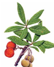
Medronheiro | Strawberry tree ( Arbutus unedo )