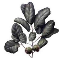
Sobreiro | Cork oak ( Quercus suber )