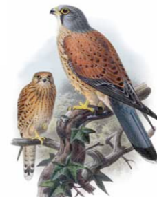
Peneireiro | Common Kestrel ( Falco tinnunculus )