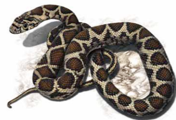
Cobra-de-ferradura | Horseshoe Whip Snake ( Coluber hippocrepis )