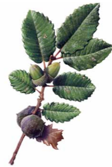
Carvalho-cerquinho | Portuguese oak ( Quercus faginea )