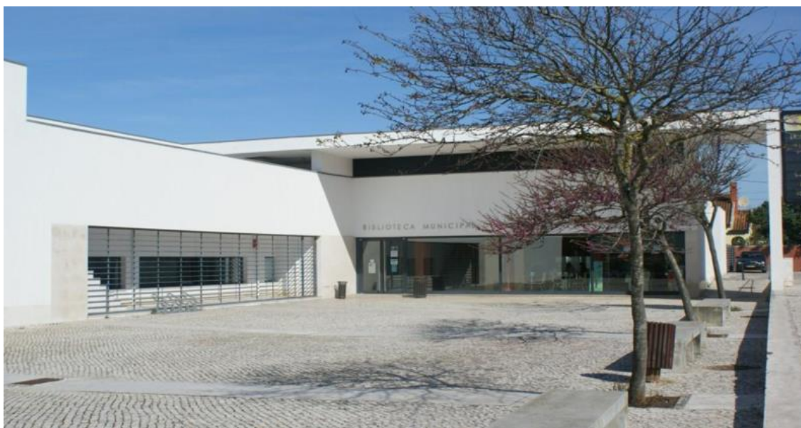
Biblioteca Municipal de S. Domingos de Rana Veja a imagem no Flickr

A Biblioteca Municipal de S. Domingos de Rana , em Massapés (Tires), junto ao Complexo Polidesportivo de S. Domingos de Rana e à Escola Secundária Frei Gonçalo de Azevedo, funciona num edifício da autoria do arquiteto João Lucas Dias, inaugurado a 23 de abril de 2005.