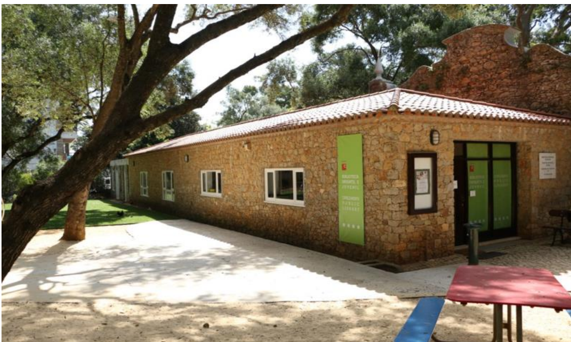
Biblioteca Infantil e Juvenil de Cascais Veja a imagem no Flickr

A Biblioteca Infantil e Juvenil , em atividade desde 1971, foi criada no Museu-Biblioteca Condes de Castro Guimarães, transitando, depois, para as atuais instalações, no Parque Marechal Carmona, que em breve serão totalmente remodeladas. Integrou a Rede de Bibliotecas Fixas da Fundação Calouste Gulbenkian até 2003, ano em que passou a ser gerida pela Câmara Municipal de Cascais.