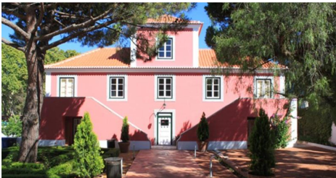
Biblioteca Municipal de Cascais – Casa da Horta da Quinta de Santa Clara