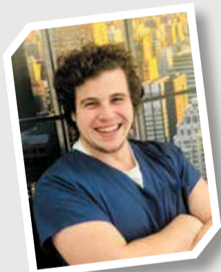
Dr. Raul Semedo Endodontia