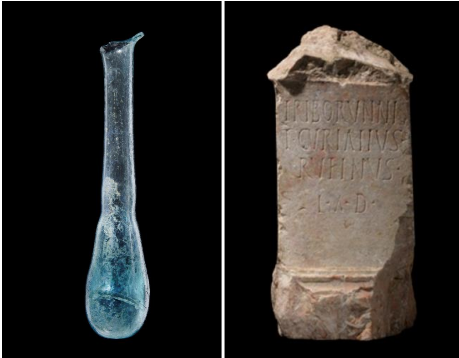
Unguentário de vidro da villa romana de Freiria, S. Domingos de Rana Veja a imagem esquerda no Flickr