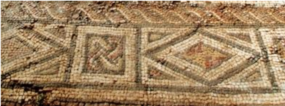
Moldura do mosaico que atapetava o triclinium da domus da villa romana de Freiria, S. Domingos de Rana Veja a imagem no Flickr

Mas também se importaram novas ideias. Neste contexto, a adoção de uma religião politeísta imperial seria concretizada de forma pacífica, uma vez que o império soube integrar as divindades autóctones no panteão dos seus deuses maiores. São estes deuses locais, como Triborunnis ou Aracus Aratoniceus , que vamos encontrar nos altares de pedra ( ara ) que amiúde têm sido descobertos nas villae romanas de Cascais. Também se encontraram no decurso das intervenções arqueológicas nestas villae indícios que nos remetem para práticas rituais mágico-religiosas. Procurava-se, assim, a bênção dos deuses para a fertilidade dos campos, prevenir o mau-olhado ou agradecer, num ritual de abandono, o uso de um espaço. Também do culto aos mortos nos falamos vários monumentos epigrafados, muitos deles identificados nas necrópoles que circundavam as villae , que nos recordam a perda de alguém próximo quando lemos no epitáfio sit tibi terra levis (que a terra te seja leve).