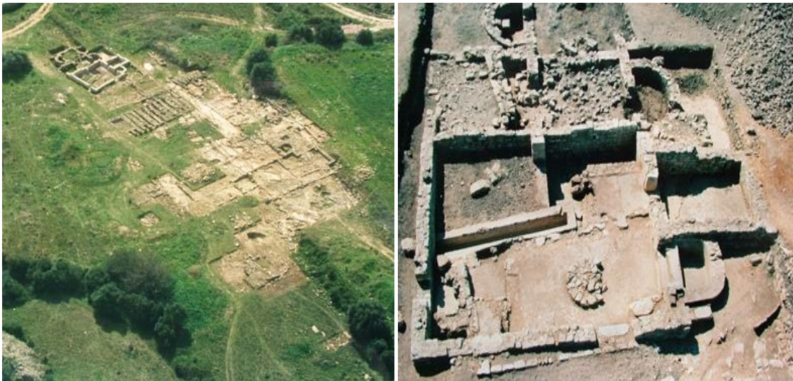
Vista aérea da villa romana de Freiria, S. Domingos de Rana Veja a esquerda e direita no Flickr

Situadas em zonas em que a agricultura, a pecuária ou a pesca constituíam as ocupações dominantes, estas villae procuravam, antes de mais, satisfazer as necessidades de consumo do proprietário, dos seus dependentes e da população que habitava em seu torno. Vestígios de lagares, estábulos, tanques de salga e transformação de pescado ou celeiros documentam a importância que estas ancestrais práticas deteriam na economia local, devendo os excedentes ser transportados para o porto de Olisipo e daí exportados para o vasto império romano.