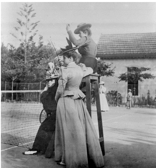
Partida de ténis na Parada, c. 1900