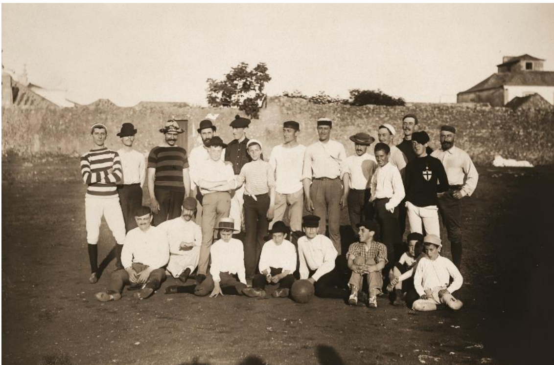
Pioneiros do futebol português. Cascais, 1888 Ver imagem no Flickr.

A Guilherme Pinto Basto se deve igualmente a introdução do futebol em Portugal. Foi em 1888 que decorreu, também na “Parada”, aquela que é considerada a primeira exibição de futebol entre portugueses no nosso país. Apesar de o cavalheirismo que caracterizava os sportsman ter certamente imperado, a inexperiência dos jogadores e a má qualidade do terreno devem ter proporcionado aos assistentes uma competição peculiar... Este desporto popularizar-se-ia rapidamente, assistindo-se à criação de equipas um pouco por todo o concelho, com fortes ligações ao associativismo local, como sucedeu com o Grupo Dramático e Sportivo de Cascais, o Grupo Sportivo de Carcavelos ou o Parede Futebol Clube.