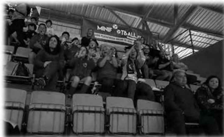
Vídeo Cascais Futsal Cup 2019