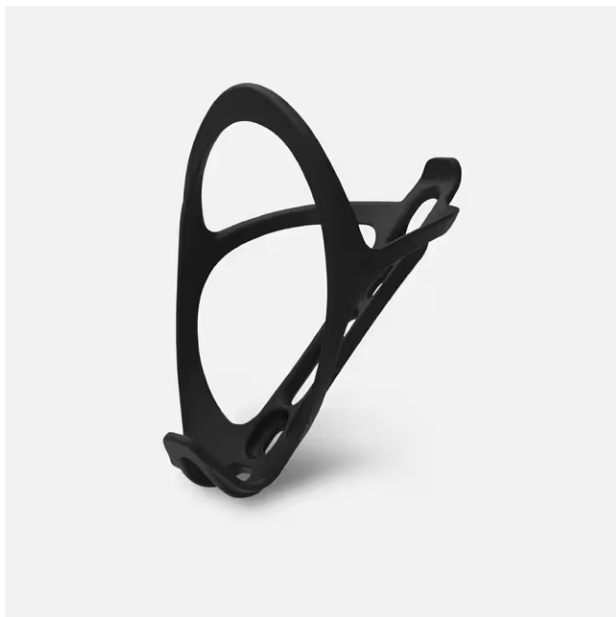
VAN RYSEL Porta-Bidon de Bicicleta de Estrada/Gravel 500 Preto 4,90 €