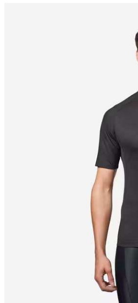
VAN RYSEL CAMISOLA DE MA ESTRADA VERÃO HOMEM - ES 9,90 €