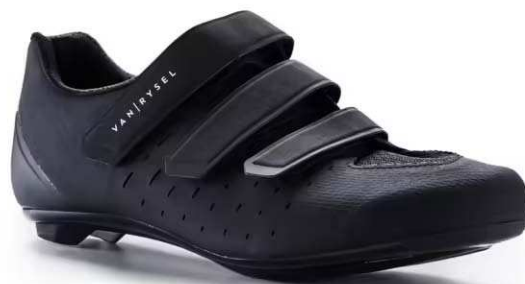
VAN RYSEL Calçado de Ciclismo de Estrada VAN RYSEL ROAD 100 Preto 59,00 €