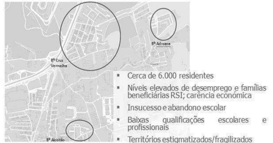
Alcoitão, BCV, Adroana Territórios alvo de intervenção