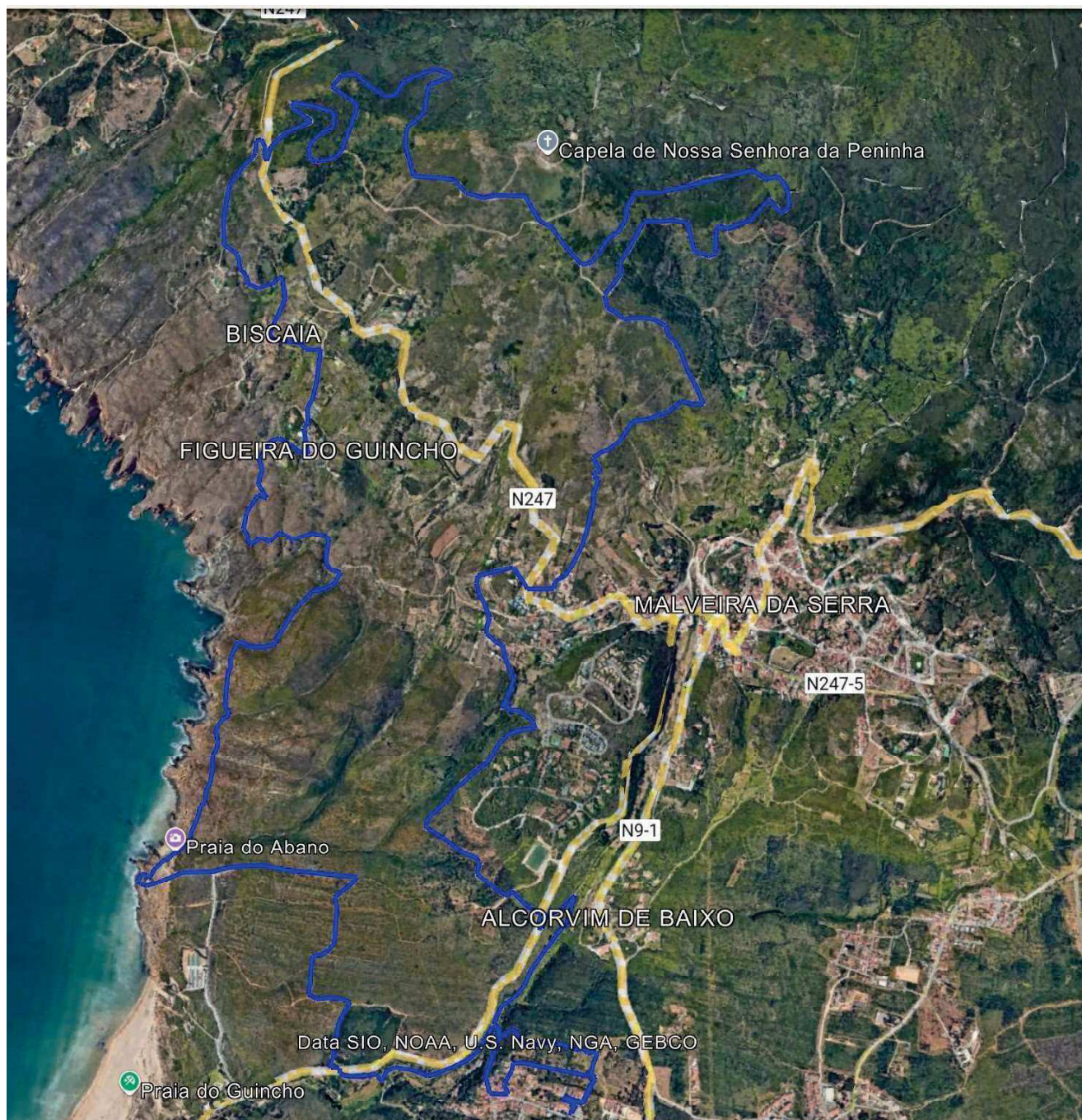
Figura 1: Mapa do percurso do Trail Longo (K20)

para retomar o estradão que desce ao longo do vale da Ribeira da Praia até à linha de falésias. Continua depois para sul ao longo de trilho pela linha de costa até ao parque de estacionamento da praia do Abano, subindo depois para atravessar o planalto do Barril, descendo novamente atravessar pela quarta vez a N-247. Daqui desce pela Rua do Varão até entrar no estradão da Quinta da Charneca, continuando para montante até à Rua do Passo Mau, iniciando de seguida a subida da encosta por trilho até retomar o estradão da Estrada da Bela Vista, continuando por um pequeno trilho até entrar na Rua do Forno, seguindo para a União Recreativa da Charneca onde está instalado o pórtico da meta.