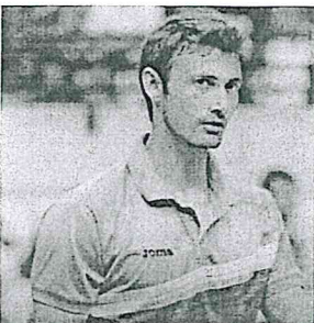
Juan Carlos Ferrero – Nº1 Circuito ATP