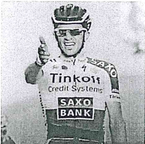
Alberto Contador – Vencedor de 4 Tours de France