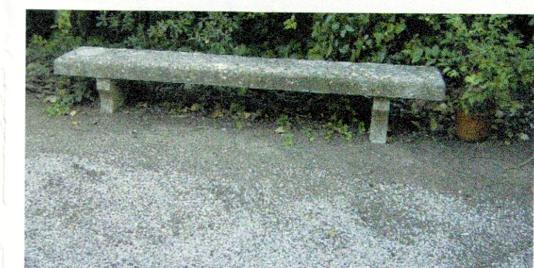
MACADAME COM SAIBRO