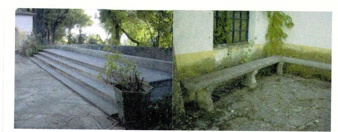
LAJEDO DE CALCÁRIO