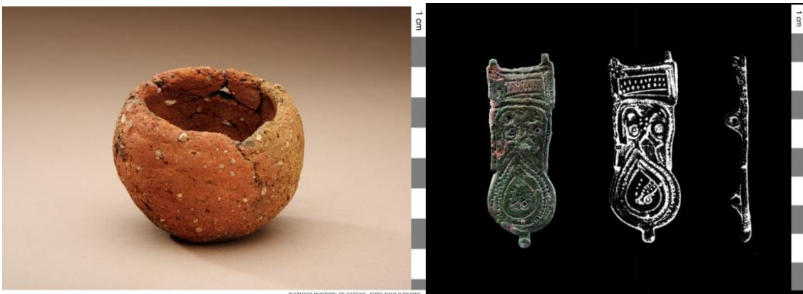
Pequeno vaso de cerâmica (3º milénio a. C.) Veja a imagem esquerda no Flickr

Do diversificado conjunto de espólio funerário recolhido neste local, urge destacar os artefactos de pedra polida e lascada, os artefactos votivos de calcário, as placas de xisto decoradas, os elementos de adorno e os recipientes cerâmicos. Atualmente algumas das peças recolhidas neste sítio arqueológico encontram-se em exposição no Museu da Vila e no Museu Geológico de Lisboa.