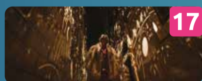
17 SWIRL INSTALAÇÃO LUMINOSA Fugara | IL Rua Marques Leal Pancada

A O SOL BRILHARÁ ASSOCIAÇÃO SOL - LARGO CIDADE DE VITÓRIA