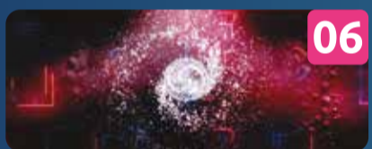
06 COLOURS AND FORMS ESPETÁCULO AUDIOVISUAL 360° OCUBO ft. The BLKBRDS & JUKEBOX crew | PT Cidadela de Cascais (Praça) VÁRIAS SESSÕES DIÁRIAS COM CAPACIDADE LIMITADA