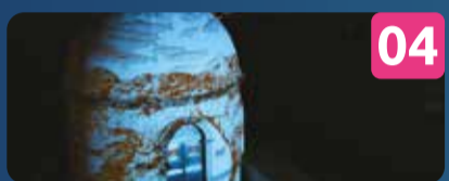
04 TRANSLUCENT VIDEO MAPPING OCUBO | PT Marégrafo Maria Pia ----- PERCURSO ALTERNATIVO