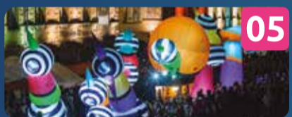
05 LAMPADOPHORES DESFILE ----- Picto Facto | FR Baía e Marina HORÁRIOS DESFILES : 20:30 | 22:30