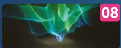
08 LUMINA X INSTALAÇÕES LUMINOSAS LIGHT METAMORPHOSIS - Laurent Fort | FR Marina de Cascais (Contentores)