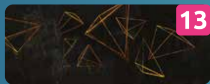
13 TETRAHEDRON INSTALAÇÃO INTERATIVA Alessandro Lupi | IT P. Marechal Carmona Jardim Biblioteca