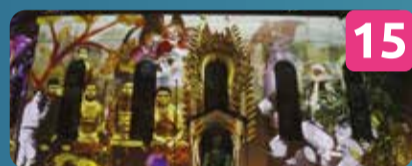
15 OF DREAMS AND LIFE VIDEO MAPPING Robert Sochacki | PL Casa das Histórias Paula Rego