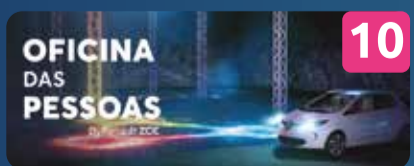
10 OFICINA DAS PESSOAS INSTALAÇÃO INTERATIVA RENAULT ZOE & OCUBO | PT Fosso da Muralha