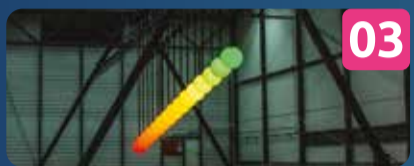
03 LARGE PENDULUM WAVE INSTALAÇÃO LUMINOSA Ivo Schoofs | NL Baía de Cascais