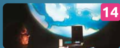
14 ELEMENTOS ZIGZAG COLOUR TRIP PERFORMANCE AUDIOVISUAL Retroanima Pro | PT P. Marechal Carmona