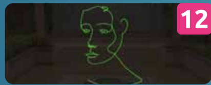
12 AB LOVE PRINCIPIUM INSTALAÇÃO LUMINOSA Ralf Westerhof | NL P. Marechal Carmona (Fonte)