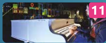
11 KEYS OF LIGHT PROJEÇÃO INTERATIVA Mr. Beam | NL Centro Cultural de Cascais