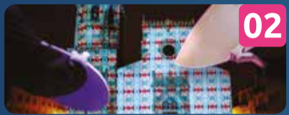
02 HUMAN TILES INSTALAÇÃO DE LUZ INTERATIVA OCUBO | PT Igreja de N. S. da Misericórdia