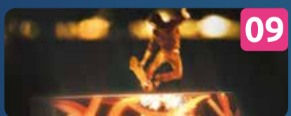
09 FLOWING LIGHT INSTALAÇÃO INTERATIVA OCUBO & Academia dos Patins | PT Fosso da Muralha