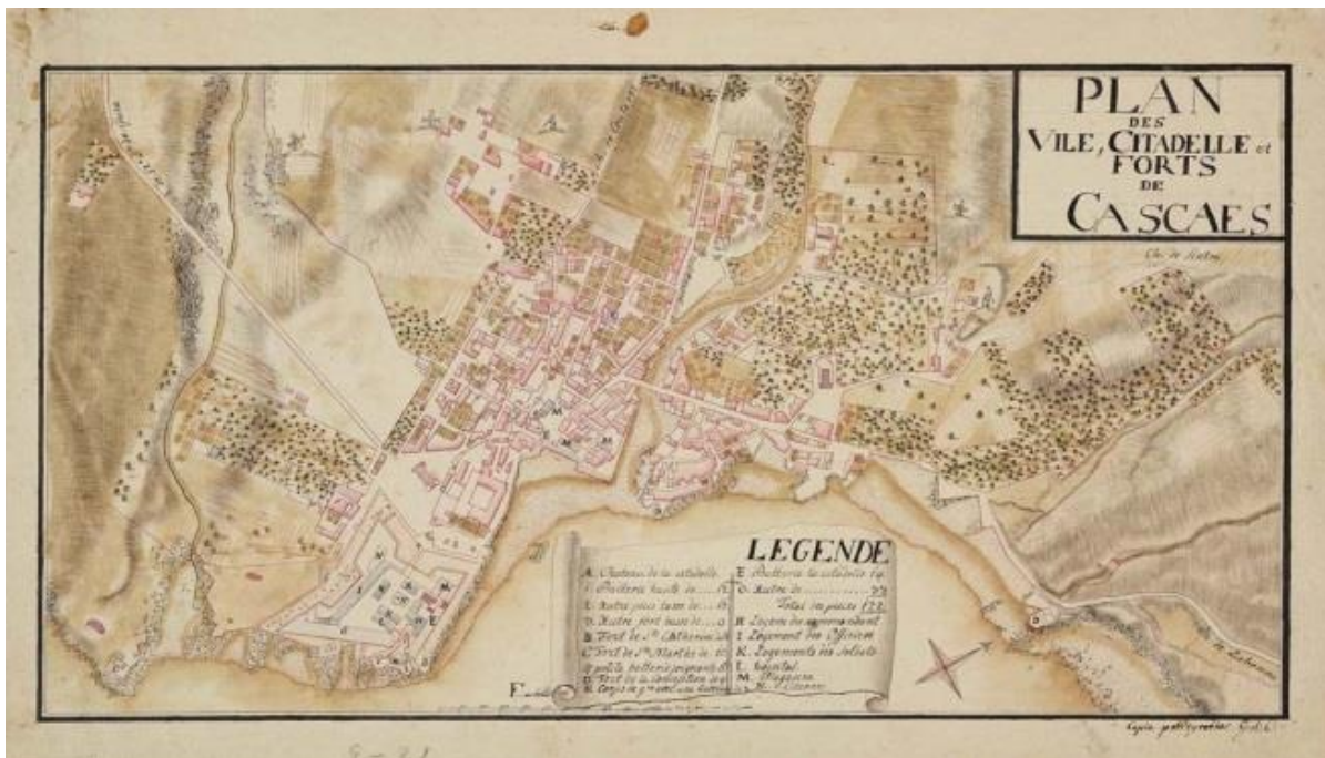
Cascais, c. 1800 Ver a imagem no Flickr

todo ficou inabitável». A vila desfigurou-se. «Suas ruas não são Ruas, são montes de pedras. Suas praças não são praças, são cúmulos de caliças. Seus templos não são templos, são montões de quebradas madeiras». Em resumo: «nenhuma [casa] deixou de padecer destruição, mais e menos, ou do terramoto, ou quando o mar saiu fora. As mais interiores da vila, o movimento as demoliu; as da borda do mar, este as soçobrou com quanto nelas havia».