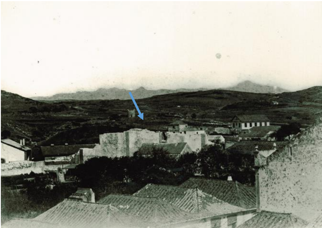
Ruínas da Igreja da Ressurreição, atual Largo da Estação, em Cascais, c. 1890

O número de vítimas mortais foi avassalador, tanto que Frei António do Espírito Santo registou, talvez exageradamente, que «Bem se pode afirmar, são 514 pessoas mortas, as finadas naquele dia, e já descobertas». Não obstante, no livro de registo de óbitos da paróquia de Nossa Senhora da Assunção não se confirmaram estes números, pois ao assentar-se o nome das vítimas enterradas no adro da igreja e daquelas a que não foram dadas sepulturas apenas se apontaram noventa e nove nomes. O mesmo sucedeu na da Ressurreição, onde se anotaram noventa mortes, escrevendo-se que «pereceram muitas pessoas, umas soterradas debaixo das ruínas que fez o mesmo terramoto, outras que o mar afogou e algumas que ainda se não descobriram».