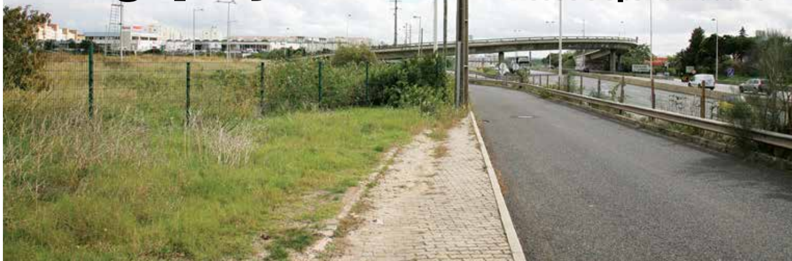
Terreno para onde está projectado o empreendimento imobiliário "Forte Center", paredes-meias com a A5 (Lisboa-Cascais)

Numa visita de trabalho em que não teve receio de percorrer alguns dos piores pontos negros de Carnaxide, desde os estrangulamentos diários na circulação automóvel à degradação e vandalização de diversos prédios e espaços públicos (sobretudo na Outeira), passando pelos montes