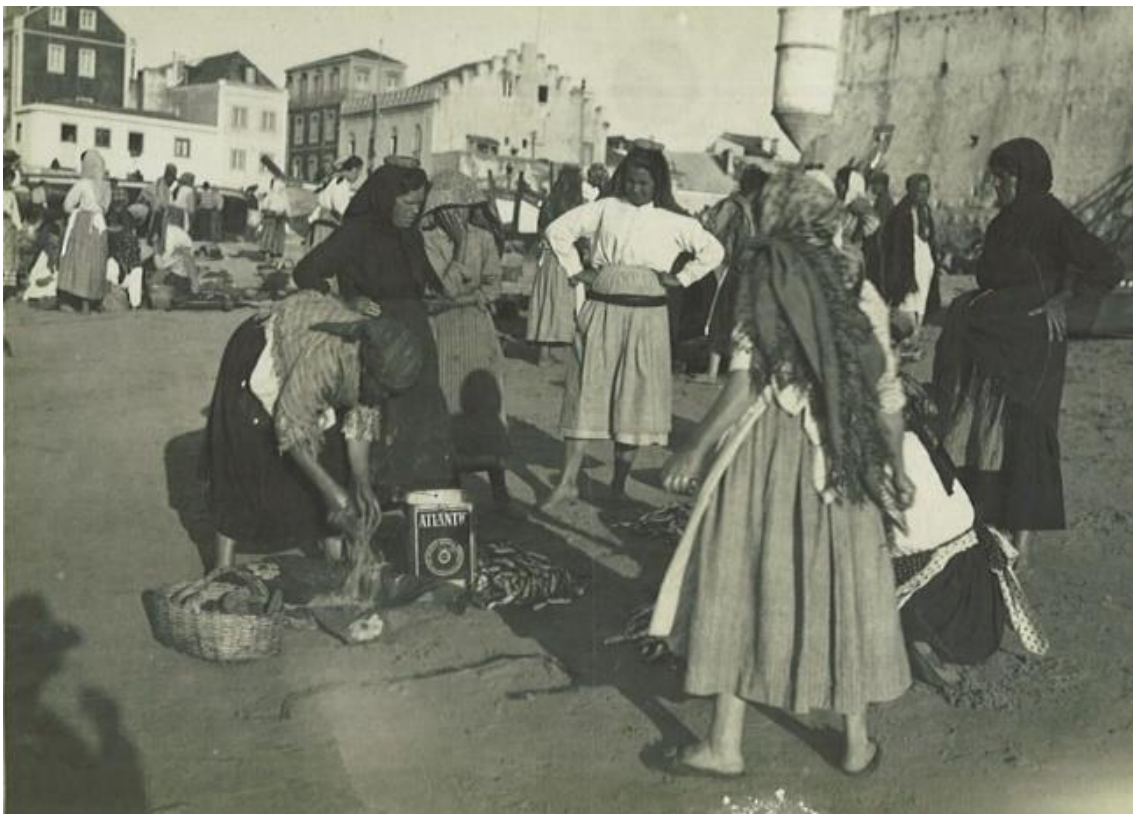
Varinas em Cascais, c. 1930 Veja a imagem no Flickr