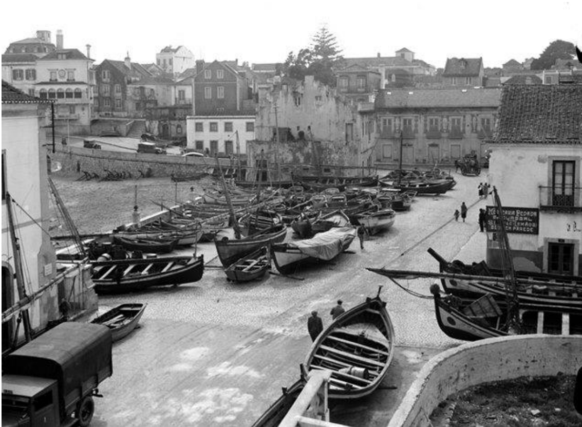
Barcos na praia da Praia da Ribeira, c. 1930 Veja a imagem no Flickr

A pesca também teve de se adaptar ao desafio do crescimento e para lhe fazer face foram lançadas ao mar as primeiras armações valencianas para a captura de sardinha, iniciando-se, com este processo, a exploração intensiva ou industrial da pesca em Cascais. O sucesso deste método foi considerável e logo em 1882 uma portaria estatal delimitou os locais da baía onde se podiam lançar armações para a pesca da sardinha, de forma a resguardar a rota tradicional das embarcações que fundeavam na vila antes de entrarem na Barra do Tejo.