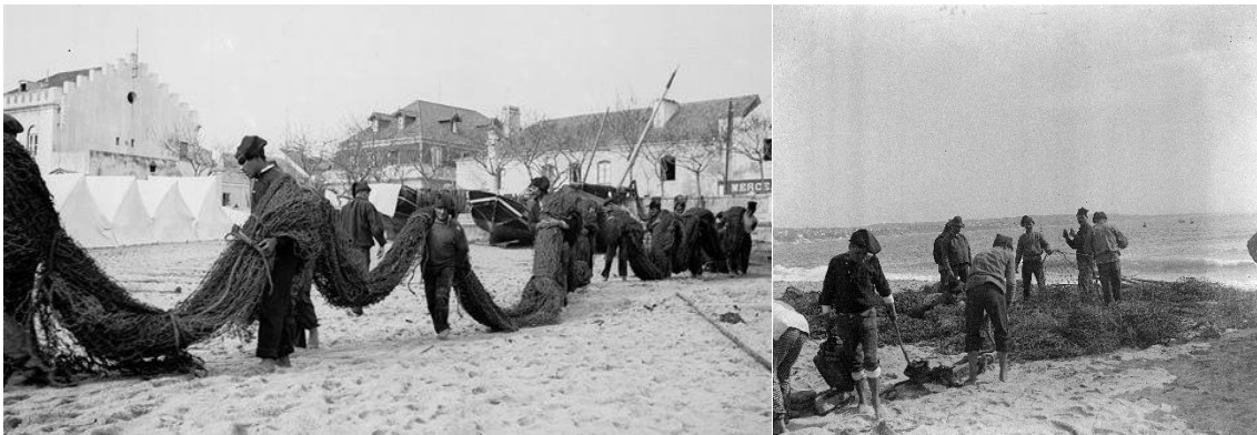
Pescadores com redes na Praia da Ribeira, em Cascais, c. 1900 (à esquerda) e c. 1950 (à direita) Veja as imagens esquerda e direita no Flickr

A pesca é uma atividade desenvolvida no mar, mas cujas bases do trabalho assentam em terra, o que significa que diversos tipos de trabalho eram efetuados antes ou depois de se colocar ou retirar a embarcação da água. No início e no final de cada campanha o material tinha de ser limpo e arranjado. Os trabalhos mais leves eram quase sempre feitos na praia e os restantes na Parada, atual Jardim Costa Pinto.