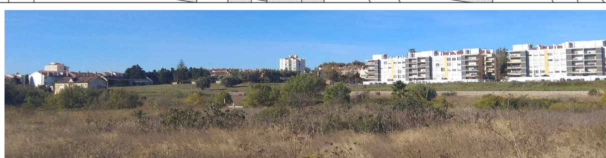
Vista para Carcavelos centro