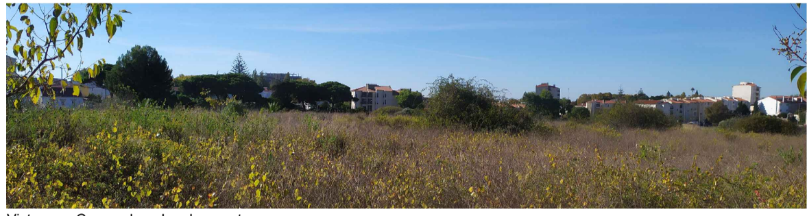
Vista para Carcavelos - Lombos norte