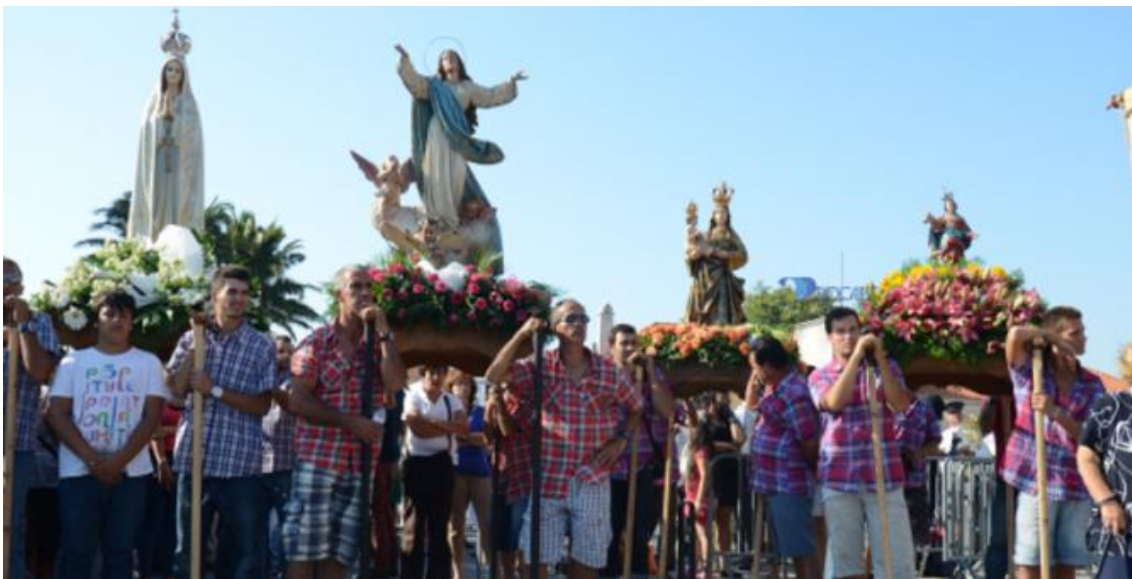
Procissão de Nossa Senhora dos Navegantes, Cascais, 2013 Veja a imagem no Flickr

A procissão apenas voltaria a realizar-se em 1992, por ocasião dos festejos no Dia da Marinha, em Cascais, vindo, desde então, a ser promovida todos os anos no âmbito das «Festas do Mar». Atualmente está a cargo da comunidade piscatória local, sendo organizada pelas duas associações ligadas a esta atividade: a Associação de Armadores e Pescadores de Cascais e a Associação de Profissionais de Pesca, em parceria com a Paróquia de Cascais e a Câmara Municipal de Cascais. Quem determina a data da procissão, que se realiza sempre num domingo de julho ou agosto, são os elementos da comunidade piscatória, em função das marés.