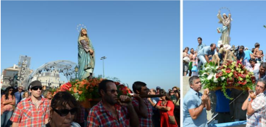
Procissão de Nossa Senhora dos Navegantes, Cascais, 2013

A escolha das oito imagens que habitualmente saem na procissão é definida pela Paróquia de Cascais e pelos elementos da comunidade piscatória, dando-se início à sua preparação na 6.ª feira anterior. As imagens são, então, transferidas para o Centro Cultural de Cascais, para que no sábado uma florista, com o apoio de peixeiras e antigas varinas, enfeitem os andores.