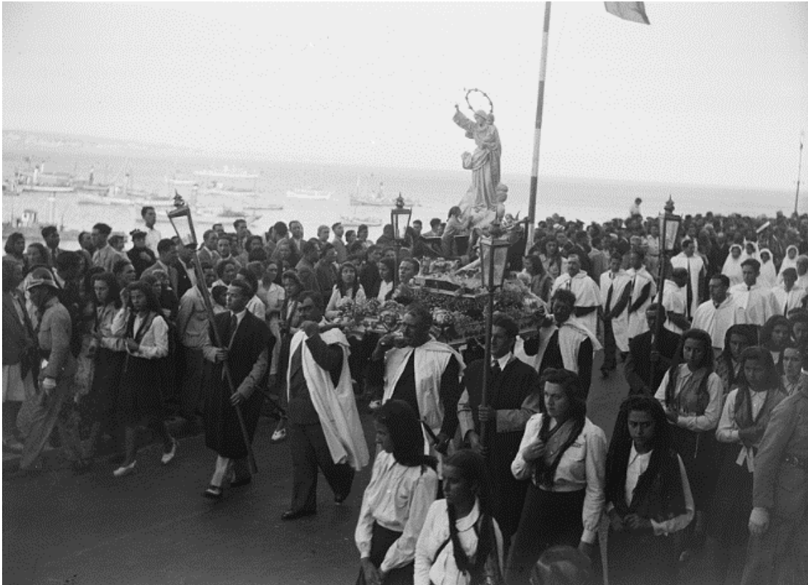
Procissão de Nossa Senhora dos Navegantes na Avenida D. Carlos I, em Cascais, 1942 Veja a imagem no Flickr

Foi então que saiu pela primeira vez à rua uma imagem de Nossa Senhora dos Navegantes, com o menino no braço esquerdo e resplendor carregado de estrelas sobre uma nuvem assente num barco, com um anjo ao leme, onde um pescador se ajoelha.