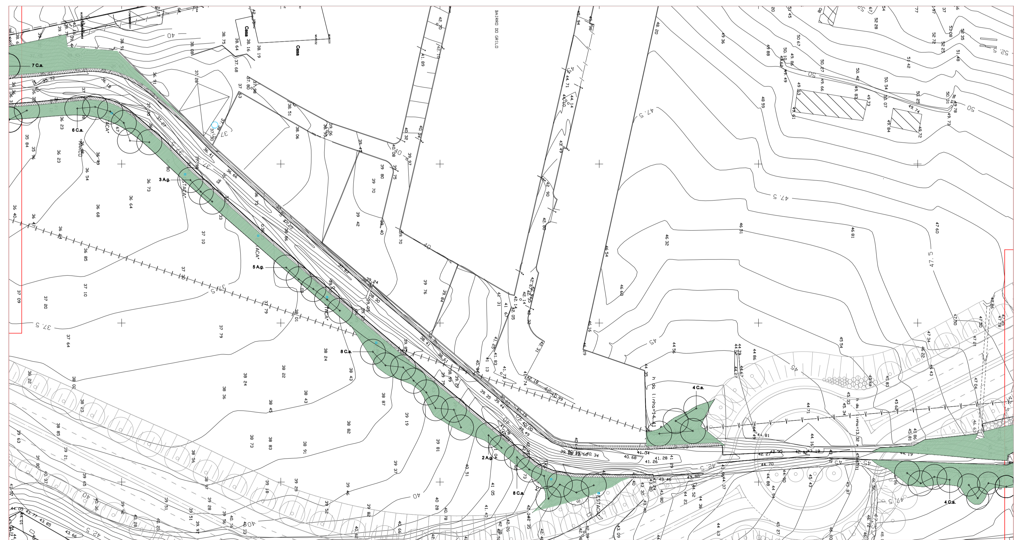
PLANTA PARCELAR B