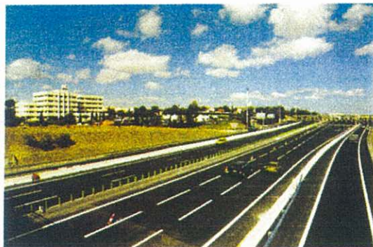
Foto 2 – A5 : Faixa non-aedificandi adjacente aos edifícios da Brisa