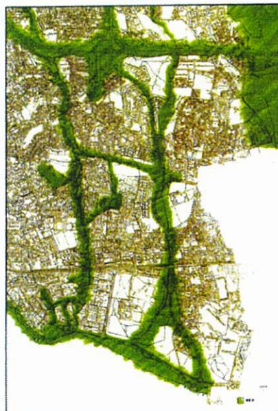
Figura 3 – Proposta de REM elaborada pela CMC

Em síntese, considerando-se aceitáveis as razões apresentadas para proceder à alteração do PROT-AML, referem-se e justificam-se, desde já, as matérias que deverão ser objecto de rectificação e adicionadas ao âmbito do PROT-AML, e que constam do projecto de Resolução de Conselho de Ministros.