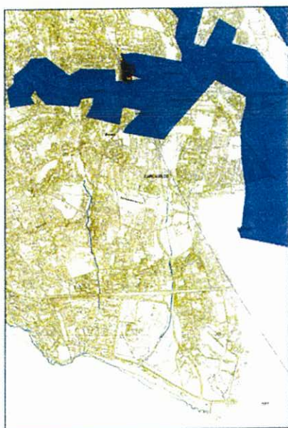
Figura 2 – Rede Ecológica Municipal – PROT - AML

Como exemplo, apresentam-se as plantas que se incluíram no processo da CMC de Janeiro de 2008, relativo à compatibilidade do Plano com a Rede Ecológica Metropolitana no âmbito do Plano de Pormenor para a Instalação da Sede Nacional da Brisa, e em que se compara a REM do PROT (Figura 2) e a Proposta de REM da CMC (Figura 3).