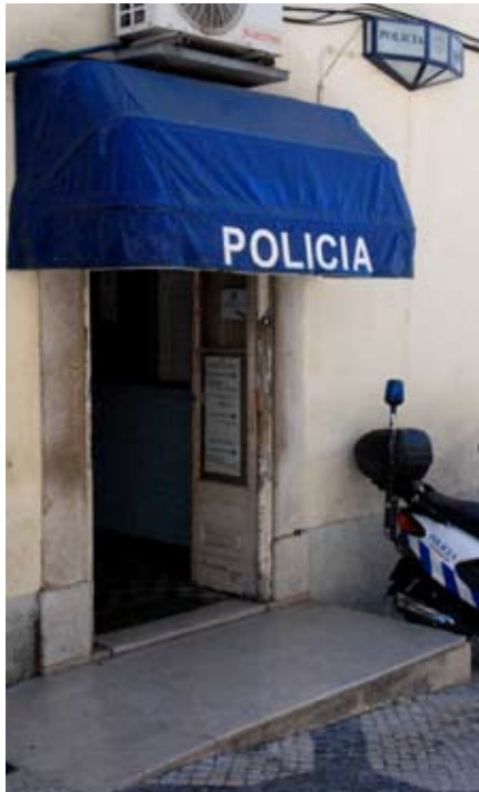
RUA AFONSO SANCHES, Nº26