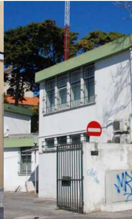
AVENIDA PIEMONTE, Nº150