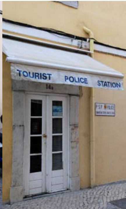
RUA VISCONDE DA LUZ, Nº 14 D