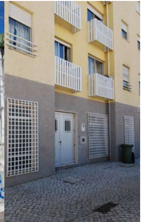
BAIRRO DA TORRE | CASCAIS