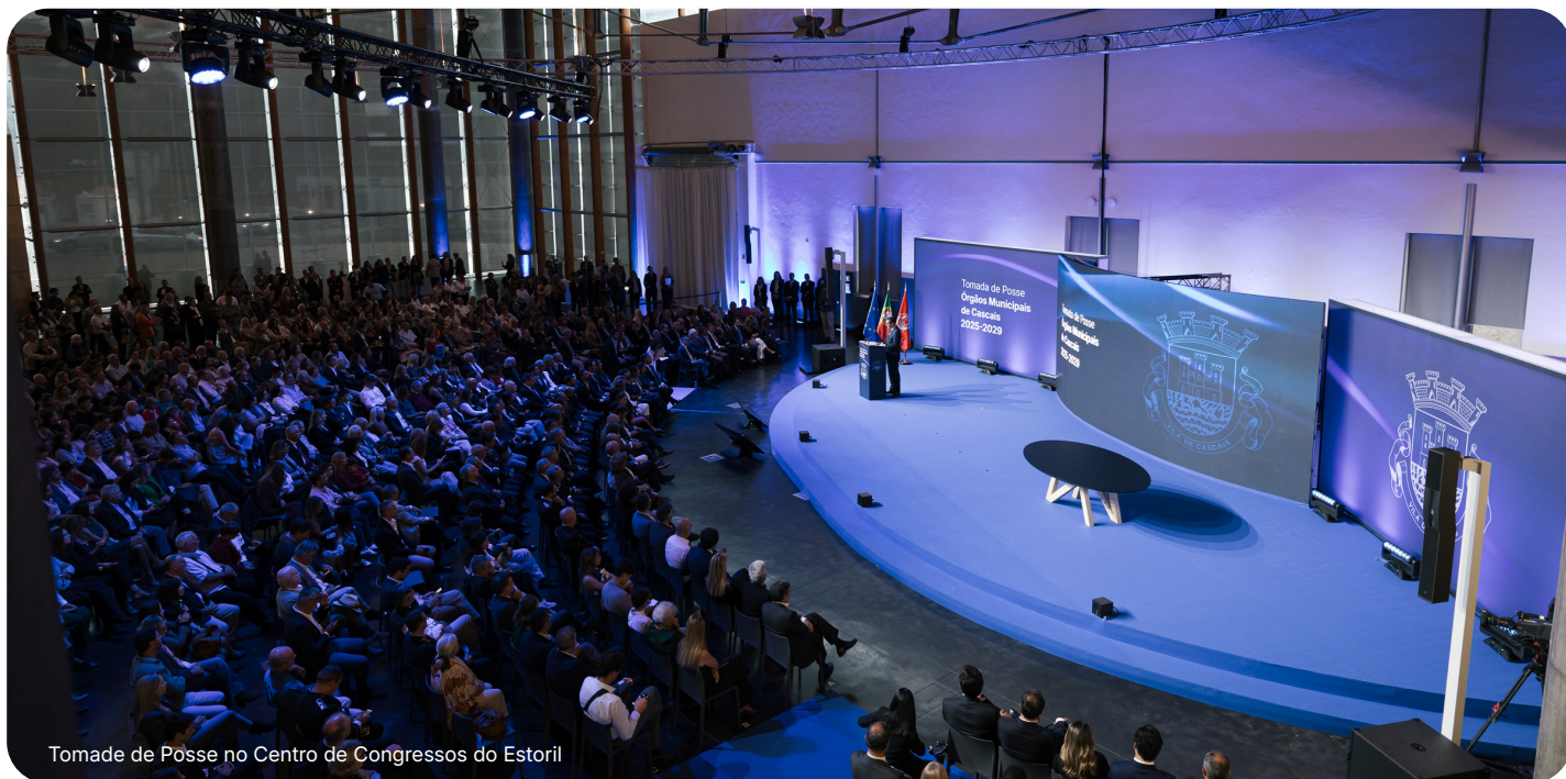
Tomada de Posse no Centro de Congressos do Estoril

Cascais prepara-se para uma nova fase de desenvolvimento e consolidação.