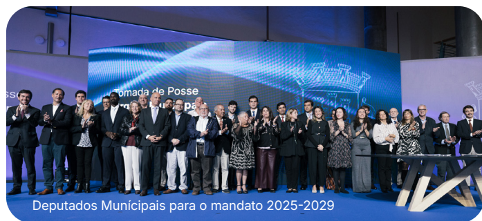
Deputados Municipais para o mandato 2025-2029