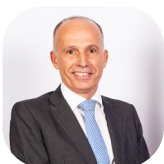
Pedro Mota Soares