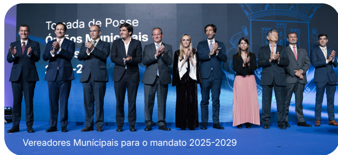
Vereadores Municipais para o mandato 2025-2029

comunidade cascaense. Nos próximos anos, Cascais quer continuar a provar que, quando se governa com os cidadãos e para os cidadãos, é possível alcançar resultados que ficam para a história e transformar a vida de cada munícipe. ●