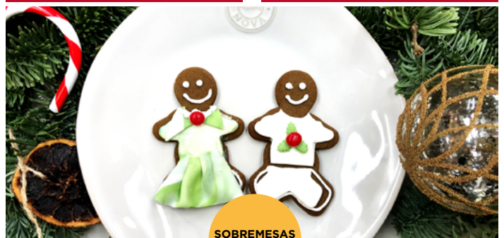
SOBREMESAS E DOCES