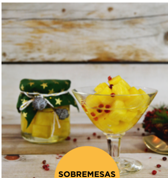
SOBREMESAS E DOCES