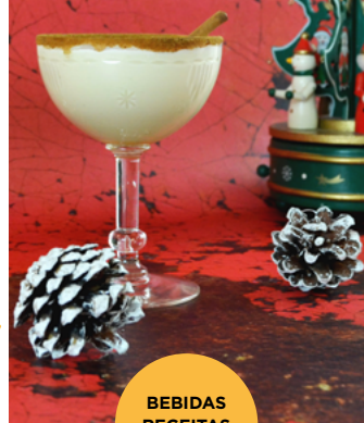
BEBIDAS RECEITAS DO MUNDO