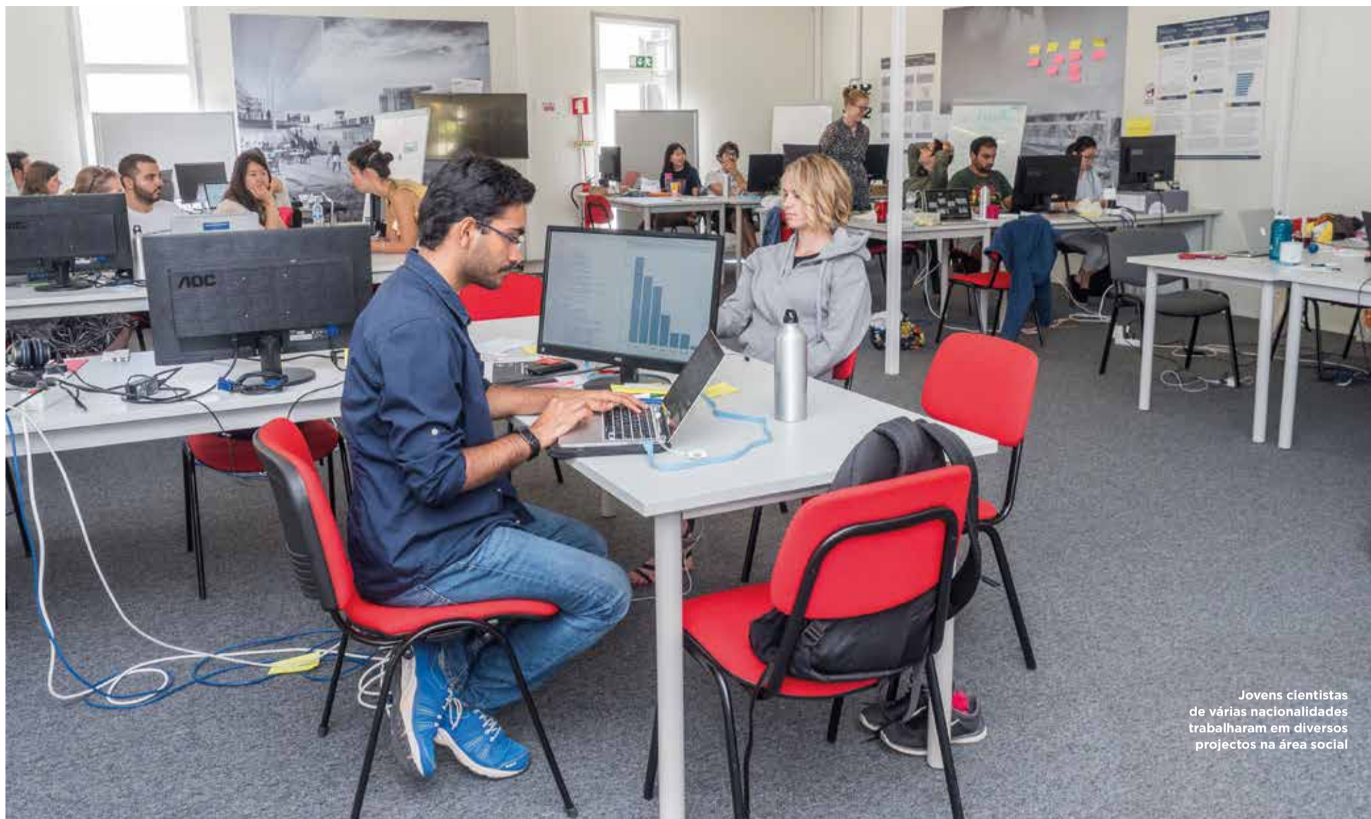
Jovens cientistas de várias nacionalidades trabalharam em diversos projectos na área social