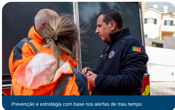
Prevenção e estratégia com base nos alertas de mau tempo