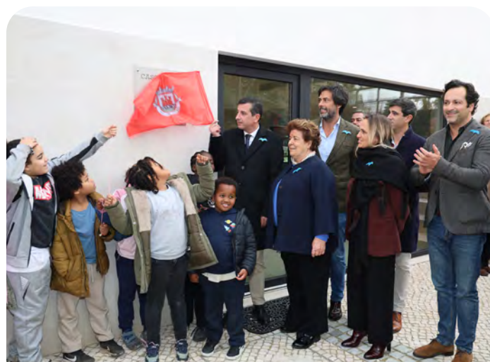
Inauguração do Polo Comunitário de Cascais, Torre