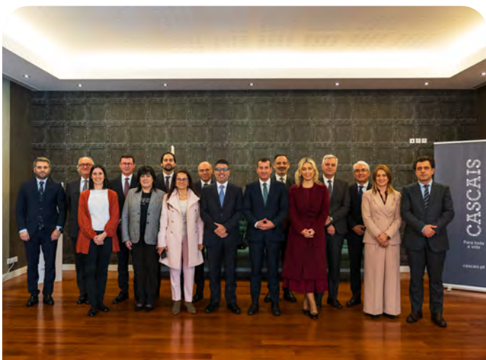
Reunião da Associação Nacional de Municípios

Significa uma forma de governar centrada nas Pessoas e na elevação da qualidade de vida individual e coletiva, com uma aposta clara na educação de excelência, na inovação, no acesso aos cuidados de saúde e bem-estar, na preservação e criação de espaços verdes e de lazer, no enriquecimento da oferta cultural, na ampliação de transportes públicos e acessíveis, na segurança e na resposta eficiente e coordenada dos serviços públicos. ●