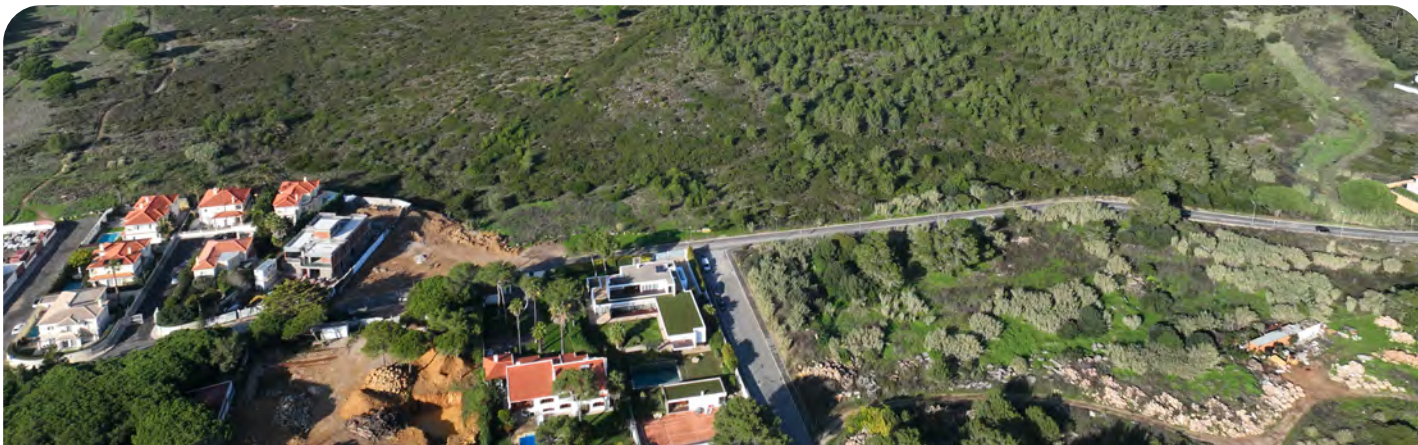
Terrenos para futuro Parque Urbano da Aldeia de Juso

Defendemos, acima de tudo, os interesses de Cascais e dos cascalenses.